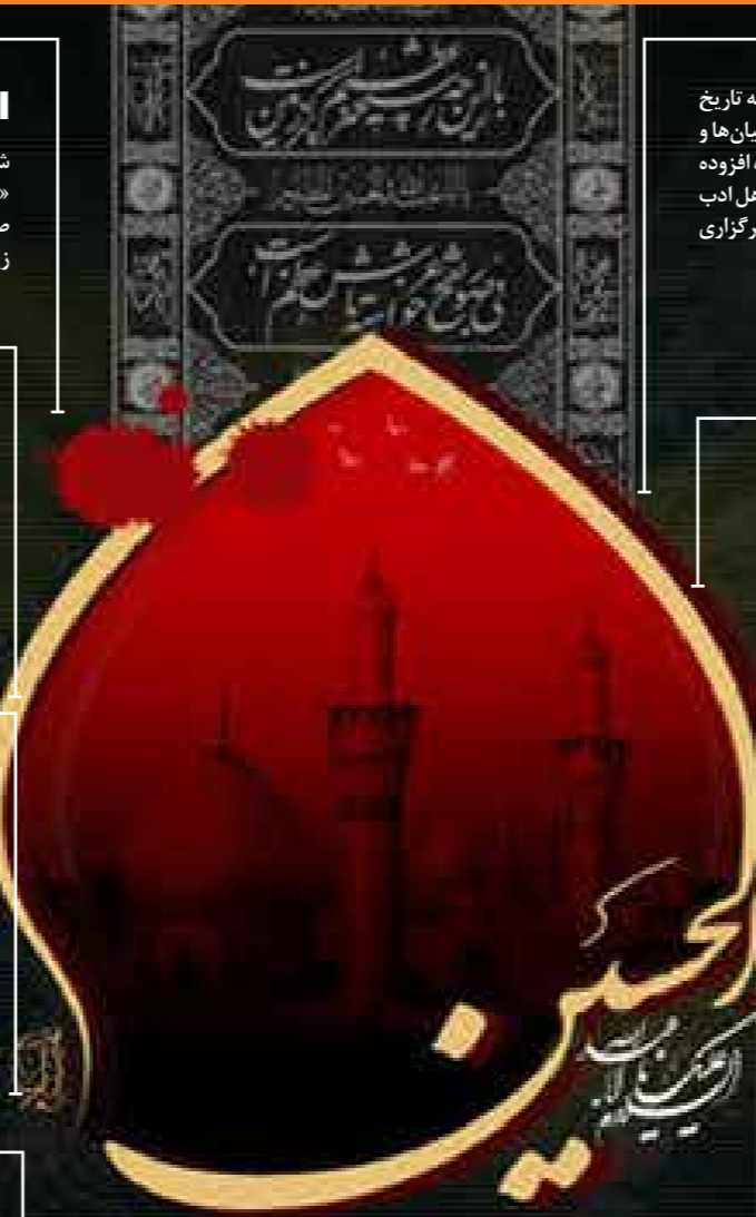
نگاهی به مجموعه‌ای از آثار فرهنگی که بوی محرم و عاشورا می‌دهند (بخش نخست)