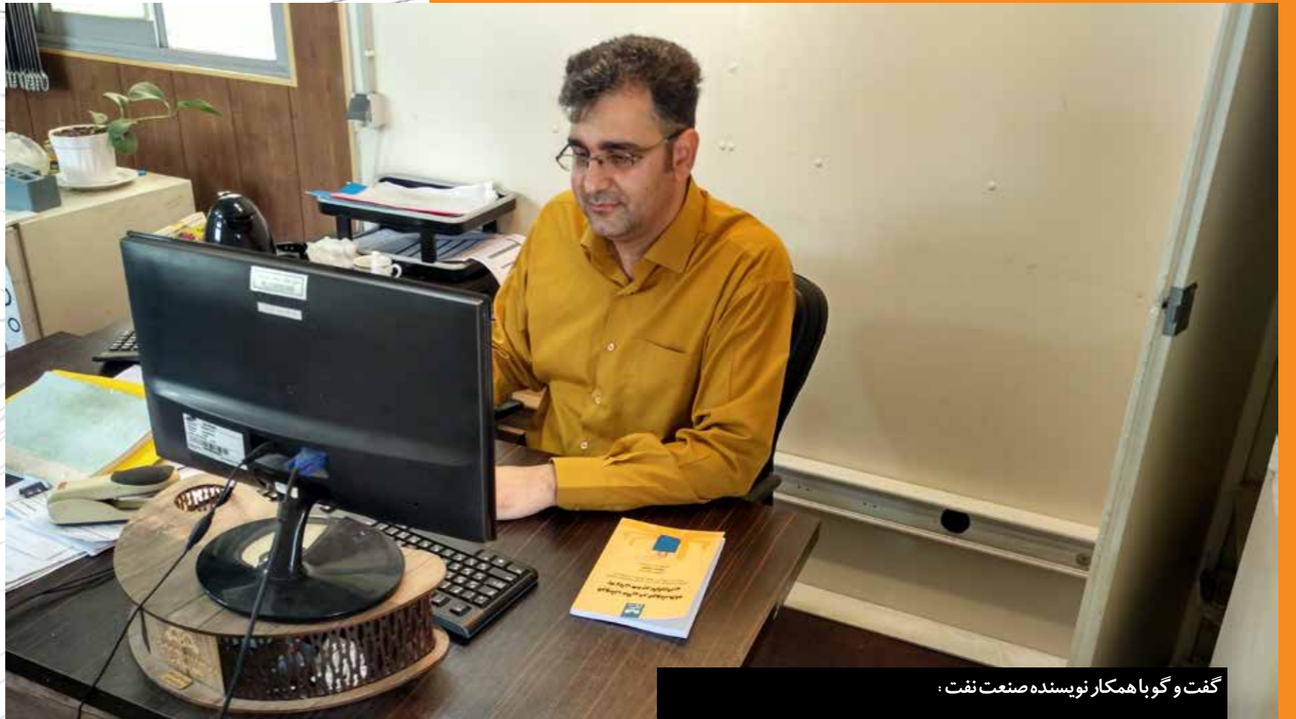
گفت و گو با همکار نویسنده صنعت نفت:

«نقش خانواده و همسر تان در کسب موفقیت در کار و تالیف کتاب را چگونه می‌بینید؟» بدون شک یکی از مهم‌ترین عوامل تاثیرگذار در موفقیت و پیشرفت من در محیط کار و امر نویسندگی، خانواده بخصوص والدین و همسر هستند. خانواده‌ام در ارائه منابع و ارجاع‌های مرتبط با کتاب کمک کار من بودند