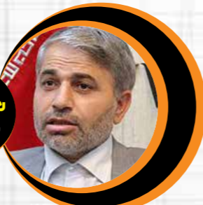
رحیمیه مافکوری نماینده سروستان در مجلس

همراه شده است و از او به عنوان خیرالموجودین یاد می‌کنند. البته اوجی هم که خود را از جنس کارکنان می‌داند، در همان آغاز معرفی به مجلس، پیامی به کارکنان صنعت نفت داد تا تاکید خود را بر اهمیت سرمایه انسانی در این سپهر مهم اقتصادی نمایان کند. حال برنامه پیشنهادی جواد اوجی در پنج فصل پیش روی نمایندگان مجلس شورای اسلامی قرار دارد تا با بررسی دقیق آن رای خود را با کارشناسی بدهند. هر چند برخی نمایندگان و کارشناسان نسبت به آنچه شانتاژ و تحرکات مغرضانه نسبت به برخی وزرا از جمله آقای اوجی خوانده شده، هشدار داده و خواهان رعایت انصاف هستند. برخی دیگر هم هنوز به جمع‌بندی نرسیده و عده‌ای هم معتقدند که گزینه پیشنهادی برای تصدی پست وزارت نفت حایز بالاترین آرا خواهد شد. استدلال این گروه با تکیه بر توان اجرایی و مدیریتی و تخصص و تجربه گزینۀ پیشنهادی ابراهیم ریسی است. نظرخواهی هفته‌نامه «مشعل» از کارشناسان اقتصادی و نمایندگان مجلس شورای اسلامی در ادامه می‌آید.