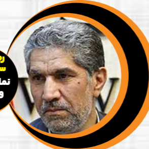
رشته‌اندیش سنگدوینی وآق قلادر مجلس

انتخاب آقای جواد اوجی، یکی از بهترین انتخاب‌های رییس جمهور است که از بدنه صنعت نفت گزینۀ پیشنهادی خود را برای تصدی وزارت نفت به مجلس شورای اسلامی معرفی کردند. بنده این انتخاب ابراهیم ریسی را به فال نیک می‌گیرم و معتقدم ایشان در میان فهرست معرفی شده به نمایندگان مجلس برای کابینه دولت سیزدهم، «خیرالموجودین» و بهترین گزینه محسوب می‌شوند. افزون بر آن کارکنان صنعت نفت با چهره‌ای که از بدنه مجموعه نفت باشد، بهتر کنار می‌آیند و اقبال بیشتری خواهند داشت. اعتقادم بر این است اگر هر فردی غیر از آقای اوجی به عنوان گزینۀ تصدی وزارت نفت به مجلس شورای اسلامی معرفی می‌شد، خطرات و ثمرات ناخوشایندی برای مجموعه نفت به همراه داشت. یک رسمی در مجموعه نفت به عنوان شرکتی و غیر شرکتی مرسوم است و هر میزان فردی سال‌های زیاد در این صنعت فعالیت کند، چون از خارج از این صنعت وارد شده باشد، غیر شرکتی تلقی می‌شود و در نظر گرفتن این مسأله از سوی آقای ریسی، حرکتی مهم تلقی می‌شود؛ از این رو امیدواریم آقای اوجی رای اعتماد را از نمایندگان مجلس شورای اسلامی کسب کند که در آن صورت با توجه به تحریم‌ها باید از وضع موجود بهترین استفاده را داشته باشد.