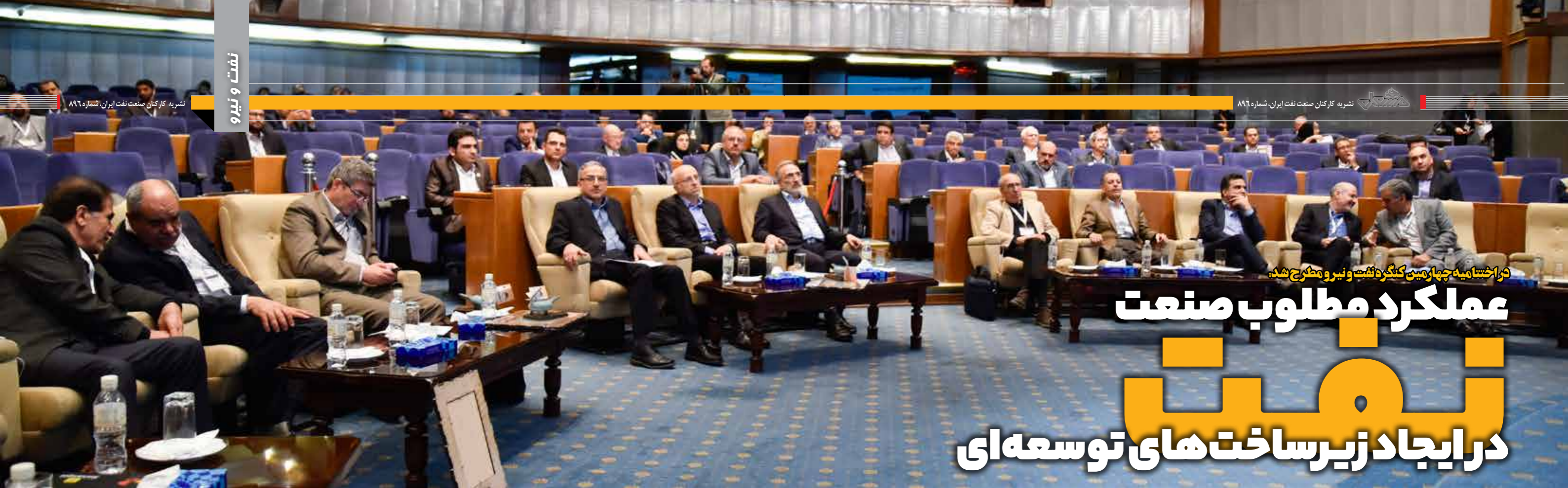
در اختتامیه چهارمین کنگره نفت و نیرو مطرح شد: