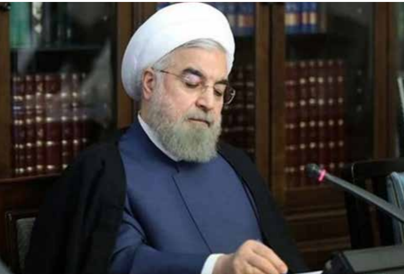
معاون اول رئیس جمهوری:

رئیس جمهوری قانون تفسیر بند «ه» تبصره (۱) قانون بودجه سال ۱۳۹۷ کل کشور را برای اجرا به وزارت نفت و سازمان برنامه و بودجه کشور ابلاغ کرد. به گزارش پایگاه اطلاع رسانی ریاست جمهوری، دکتر حسن روحانی، در نامه‌ای همسو با اجرای اصل یکصد و بیست و سوم قانون اساسی جمهوری اسلامی ایران، قانون تفسیر بند «ه» تبصره (۱) قانون بودجه سال ۱۳۹۷ کل کشور را برای اجرا به وزارت نفت و سازمان برنامه و بودجه کشور ابلاغ کرد. بر این اساس شرکت ملی نفت ایران موظف است نسبت به تامین ۴ میلیون تن مواد اولیه قیر، موضوع بند «ه» تبصره (۱) قانون بودجه سال ۱۳۹۷ کل کشور اقدام کند.