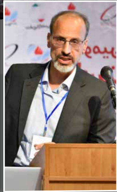
مدیر پژوهش شرکت ملی گاز ایران اعلام کرد