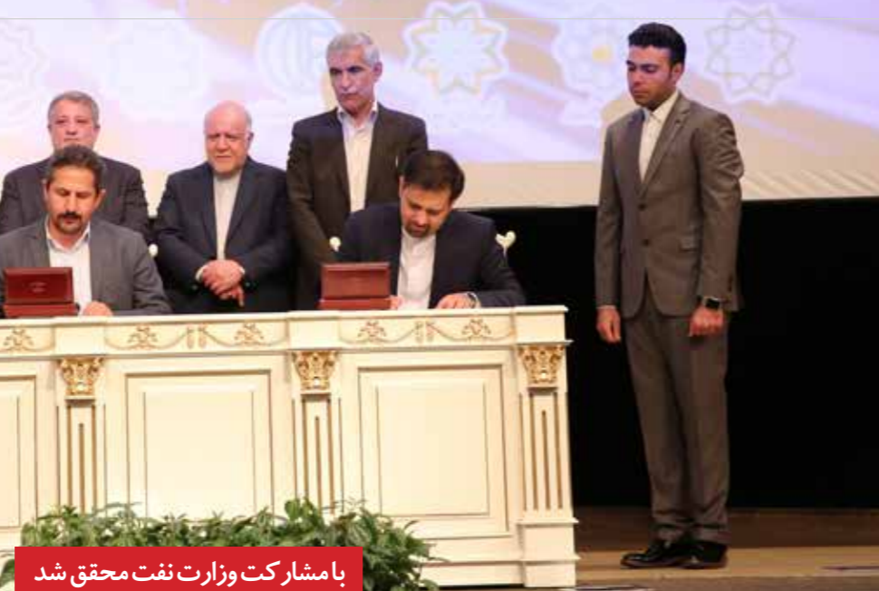
با مشارکت وزارت نفت محقق شد