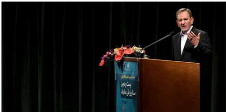
معاون اول رئیس جمهوری گفت: آمریکایی‌ها برای رای روز ۱۳ آبان تبلیغ می‌کنند و شاخص آنها رساندن صادرات نفت ایران به صفر است، بر همین اساس برخی کشورها تسلیم شدند و تعدادی نیز توجهی نکردند، ما تعدادی شریک جدید نیز برای فروش نفت یافتیم و راهکارهایی داریم تا نفت خود را صادر کنیم. به گزارش پایگاه اطلاع رسانی ریاست جمهوری، اسحاق جهانگیری، روز یکشنبه (۲۹ مهرماه) در آیین بیست و دومین سالروز ملی