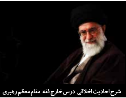
شرح احادیث اخلاقی درس خارج فقه مقام معظم رهبری