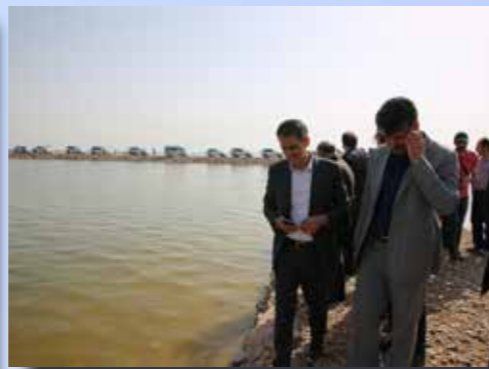
بازدید معاون وزیر نفت از غرب کارون فروردین ۹۸