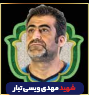
شهید مهدی ویسی تبار