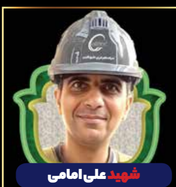
شهید علی امامی