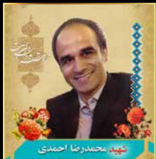
شهید محمدرضا احمدی