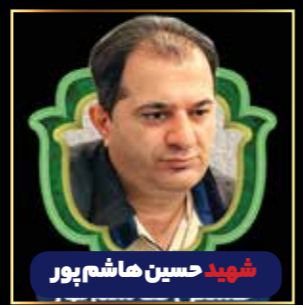
شهید حسین هاشم پور

فاطمه دهقان نیری | صنعت نفت ایران به عنوان بزرگترین هلدینگ اقتصادی، در تقویم کاری خود، روزهای پرحادثه بسیاری را به ثبت رسانده که عاملیت جنگ در آن نقش پررنگ داشته است. روزهایی که از نخستین بمباران تأسیسات نفتی در جریان حمله رسمی عراق ساعت ۳ و ۳۶ دقیقه بعد از ظهر روز دوم مهر ۱۳۵۹ آغاز شد و طی آن، بیش از یکپنجاه و ۵۵ شهید تقدیم نظام مقدس جمهوری اسلامی شدند و در ادامه روزهای جنگ تحمیلی ۱۲ روزه رژیم صهیونیستی علیه کشورمان در ۲۳ خرداد ۱۴۰۴ و جنگ ۴۰ روزه دشمن آمریکایی - صهیونی در ۹ اسفند ۱۴۰۴ که به موجب آن، تأسیسات نفتی بمباران شد و بیش از ۹ نفر از کارکنان پتروشیمی و بالایش و بخش به فیض شهادت نائل آمدند.