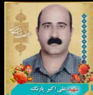
شهید علی اکبر بارزک