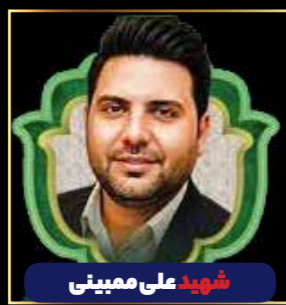
شهید علی ممینی