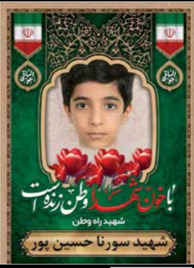
کودکی با رویاهای بزرگ

در این حادثه دلخراش، ده‌ها کودک و معلم و خانواده‌های بسیاری داغدار شدند و مدرسه‌ای که تا چند ساعت قبل پر از جنب‌وجوش بود، به یکی از دردناک‌ترین نمادهای جنگ تبدیل شد. مدرسه شجره طیبه، سه بار مورد حمله موشکی دشمن آمریکایی - صهیونی قرار گرفت.